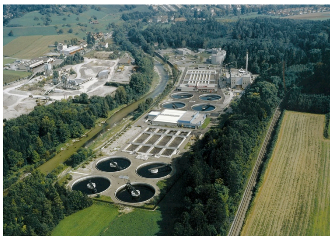
Abbildung 1: ARA von Stadtwerk Winterthur in der Hard und bestehende KS-Verbrennung

Der Wärmebedarf zum Betrieb der thermischen Desintegration des Klärschlammes sowie für die restlichen ARA-Prozesse reicht jedoch nicht aus, um eine optimale Energienutzung der bei der Klärschlammverbrennung entstehenden Abwärme sicherzustellen.