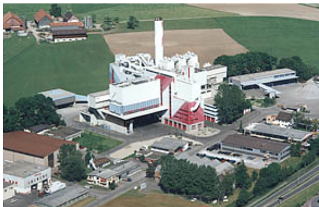
Abbildung 1: Kehrrechtverbrennungsanlage Hinwil (ZH)