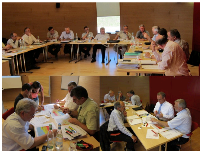
Abbildung 1: Stakeholder-Workshop mit den Geschäftsführern, ihren politischen Vorgesetzten und den Bewilligungsbehörden der betroffenen Verwertungsanlagen

Für den Kanton Zürich galt es, die gültige Planung kritisch zu hinterfragen und einen Planungsprozess anzuleiten, in dem eine technisch, ökologisch, ökonomisch und logistisch optimale thermische Verwertung von Abfällen erarbeitet wird. Die Resultate sollen breit akzeptiert und verstanden werden und damit eine hohe Glaubwürdigkeit in den Entscheidungspunkten sicherstellen.