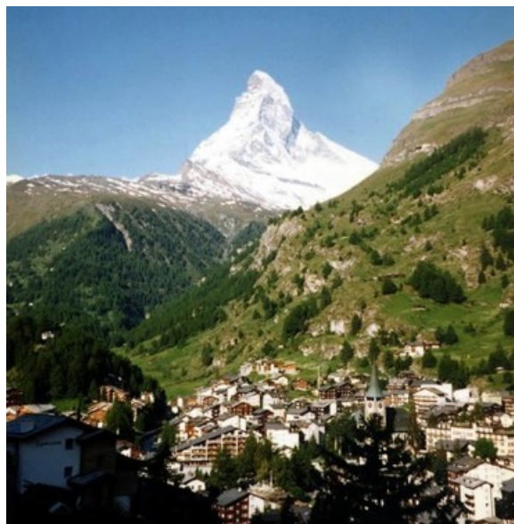
Abbildung 2: Blick auf Zermatt